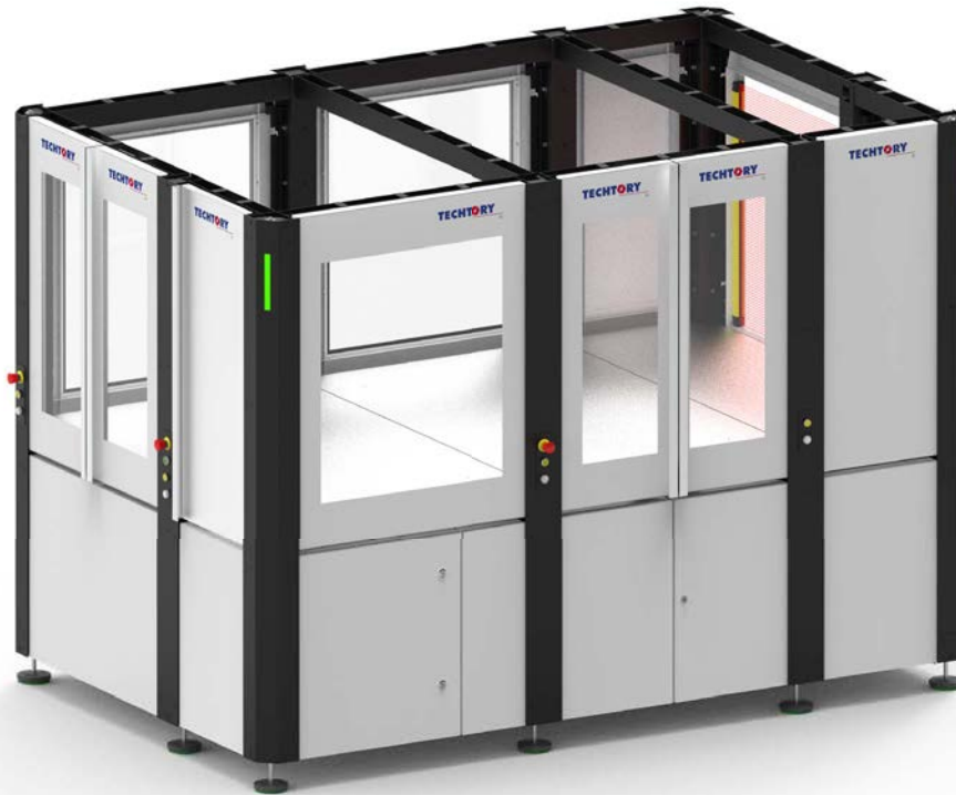
table-cell - 1.5 x 2.5