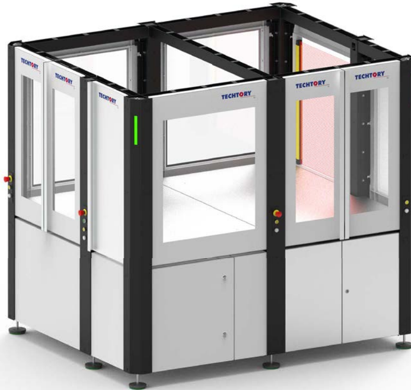
table-cell - 1.5 x 2