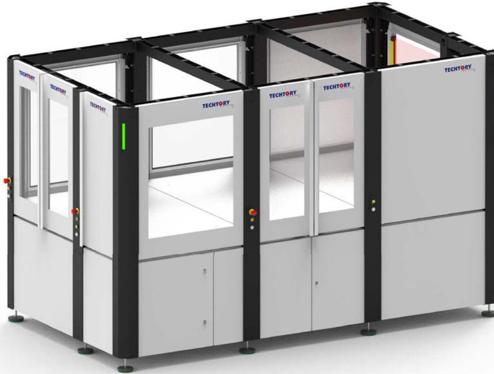
table-cell - 1.5 x 3