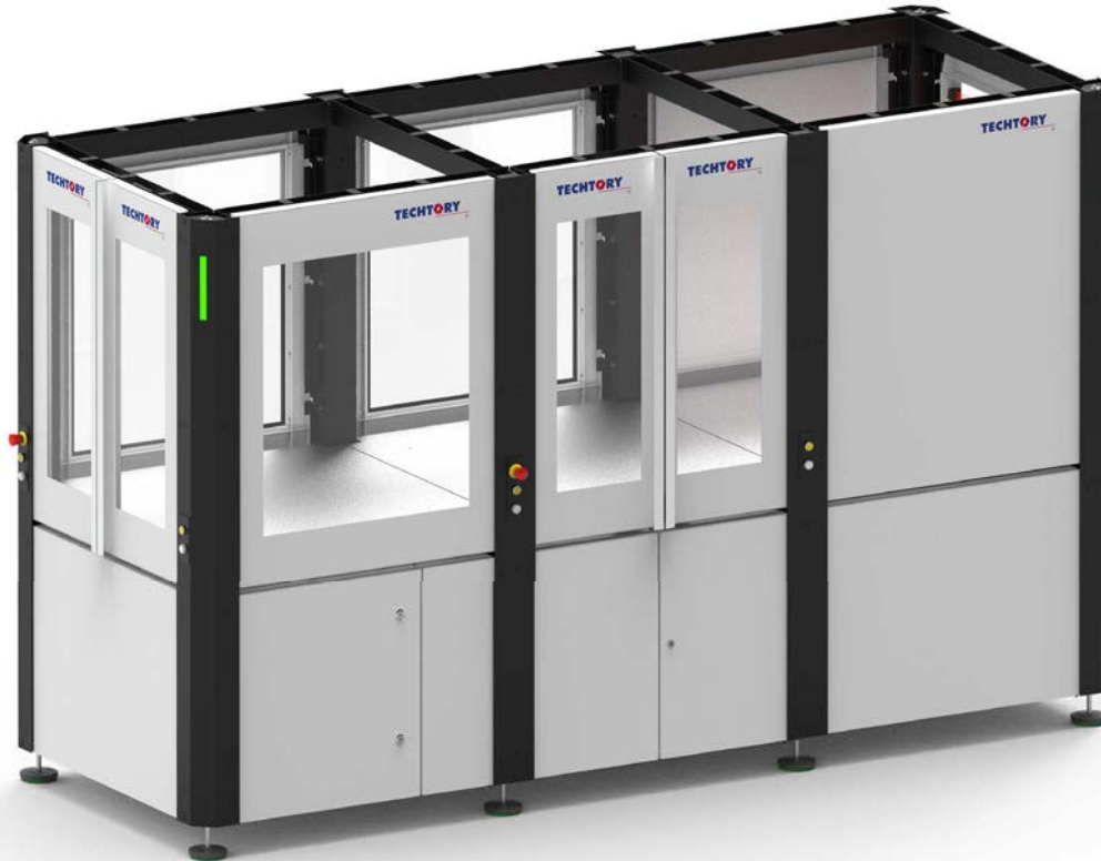
table-cell - 1 x 3