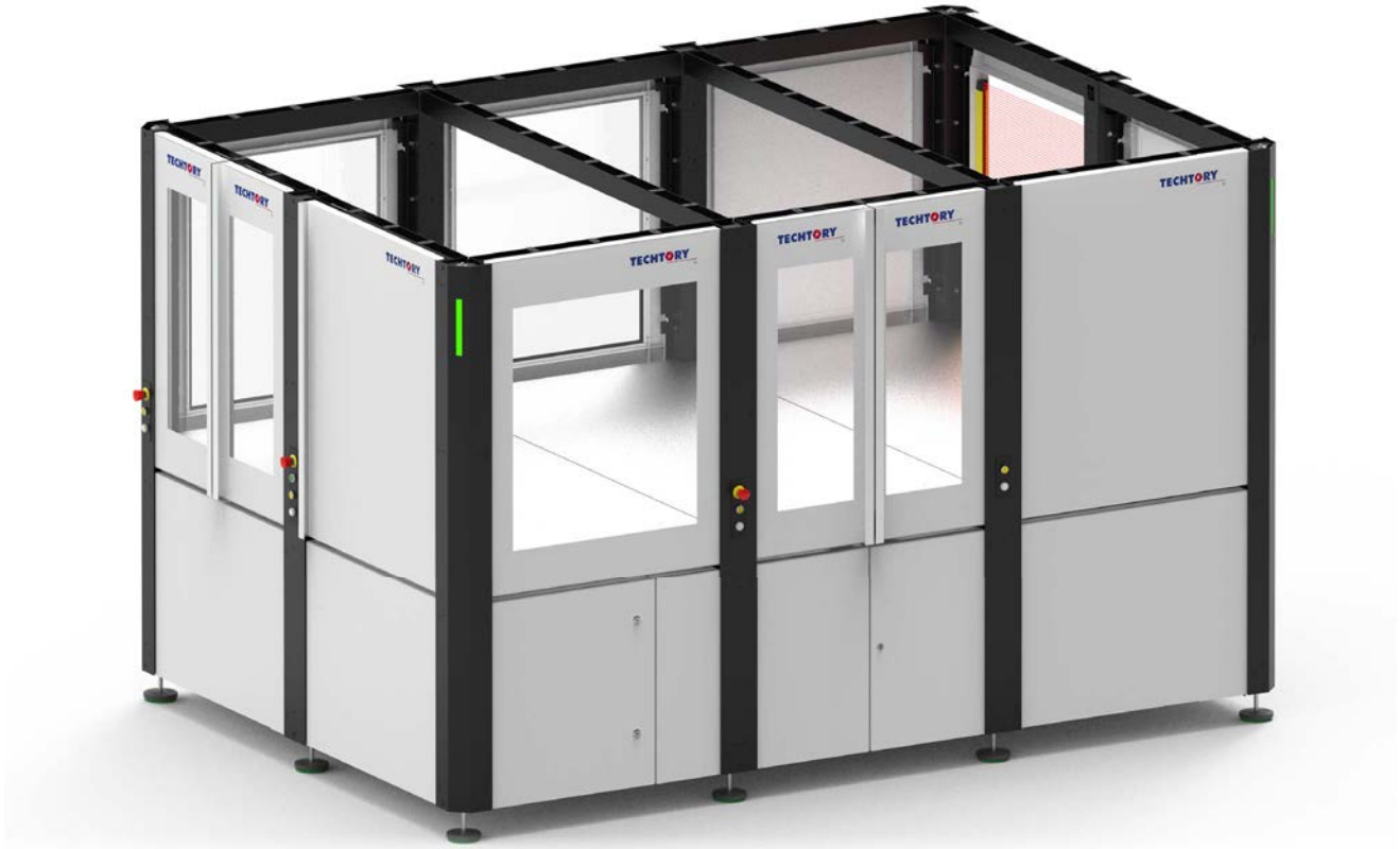
table-cell - 2 x 3